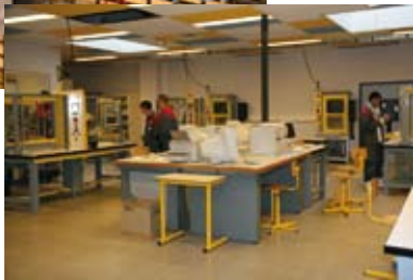
Poste de cablage d'éléments industriels, et préparation des schémas en informatique