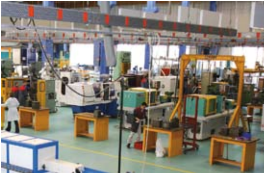
Atelier de production