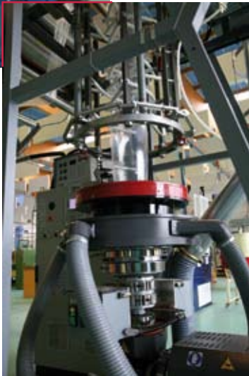
Fabrication de gaine plastique sur extrudeuse