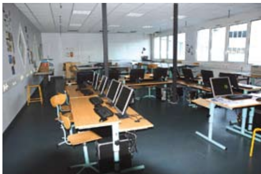
Salle informatique de PAO