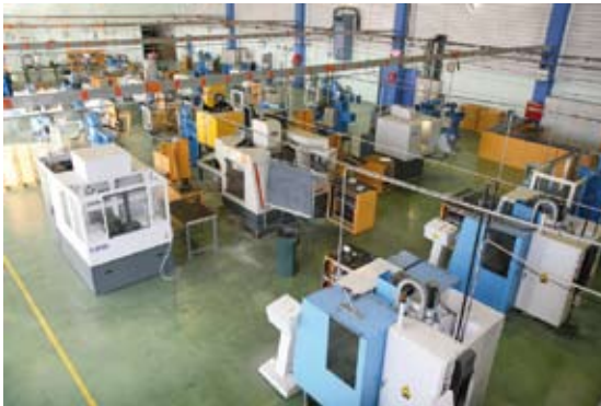
Atelier de production des outillages