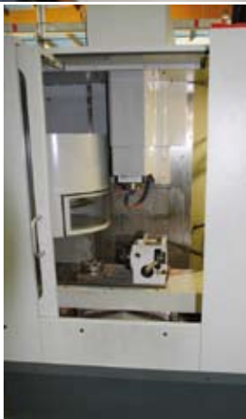
Machine U.G.V (usinage à grande vitesse)