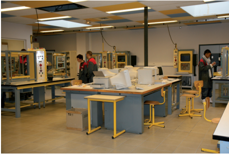
Atelier de préparation