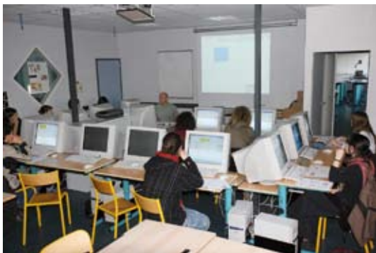
Salle informatique pour la PAO